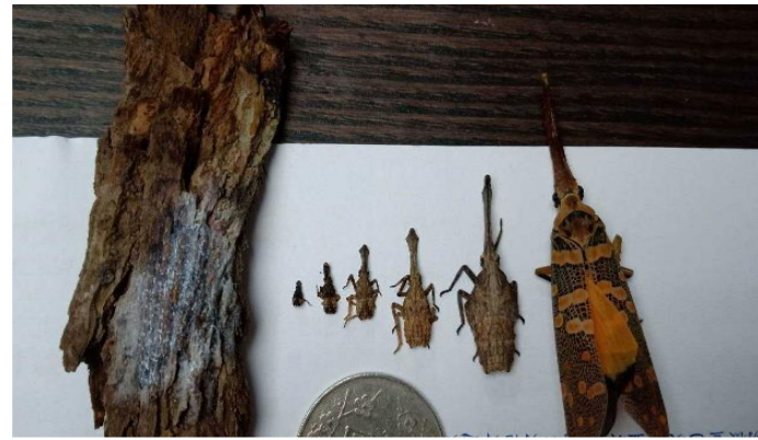
圖 6、龍眼雞卵塊、1-5 齡若蟲及成蟲