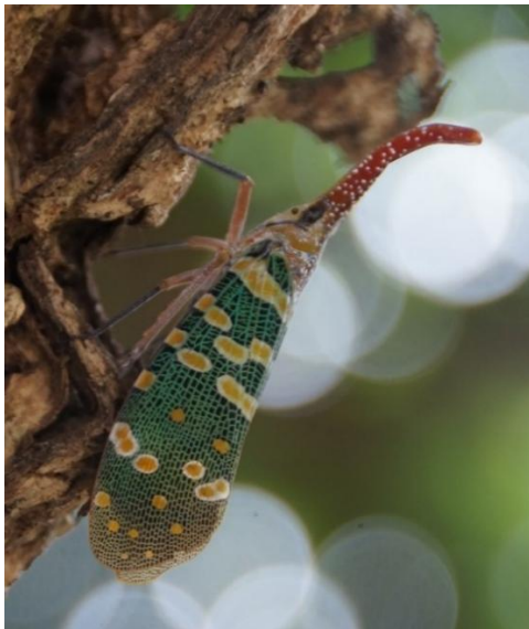
圖 5、龍眼雞成蟲棲息於龍眼樹