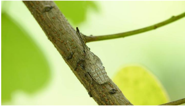
圖 4、龍眼雞若蟲棲息於烏柏枝條