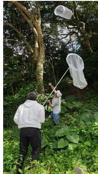
圖 7、以捕蟲網移除龍眼雞