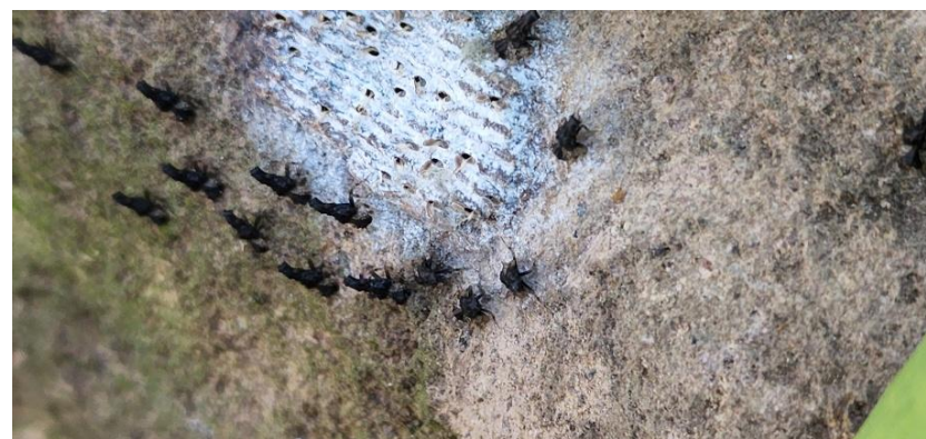
圖 3、龍眼雞卵塊孵化之若蟲