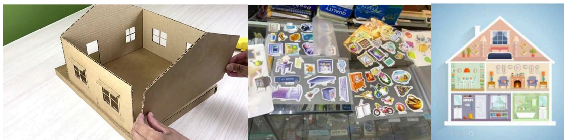
圖：種子教師未來授課可用教具-模型屋紙板與護貝圖卡

經與專業教師深入討論後，已擬定了針對國中學生的教學課綱。系列課程將包括 20 堂課，共計 900 分鐘，涵蓋講授、互動討論及手作體驗。為了確保參與本次培訓的種子師資能夠有效地將智慧淨零生活科技知識應用於後續的課堂教學，將於此時段對智慧淨零科技生活應用課綱進行詳細解說。此外，我們也會介紹教師在授課時可用的教材，供未來教學參考與調整使用。